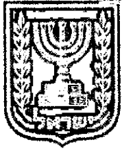
תכנון זמין מונה הדפסה 20

רצ/מק/1/16/4 השלמת חלקות דרך חקלאית-כביש 431