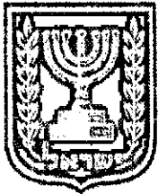
תכנון זמין מונה הדפסה 20

ועדת התכנון המוסמכת להפקיד את התכנית מקומית