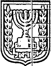
תכנון זמין מונה הדפסה 4