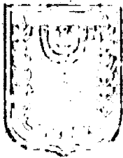
תכנון זמין מונה הדפסה 4