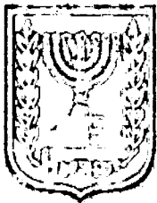
תכנון זמין מונה הדפסה 4