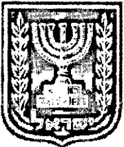
תכנון זמין מונה הדפסה 46

לא האם כוללת הוראות לענין תכנון תלת מימדי