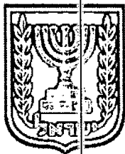
תכנון זמין מונה הדפסה 9

דף ההסבר מהווה רקע לתכנית ואינו חלק ממסמכיה הסטטוטוריים.