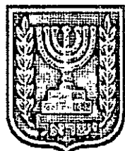
תכנון זמין מונה הדפסה 15