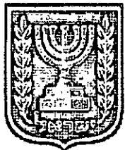
תכנון זמין מונה הדפסה 15

האם כוללת הוראות לענין תכנון תלת מימדי לא