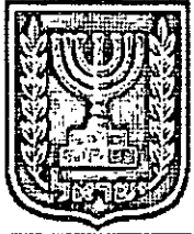
תכנון זמין מונה הדפסה 15

רחוב יבנה - ניווד שטחי בנייה במסגרת מעטפת הבניין