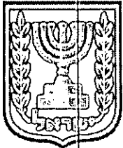
תכנון זמין מונה הדפסה 13

מטרת התכנית היא לעודד בניה חדשה באזור התעסוקה במתחם ה BBC ע"י מתן תמריץ להריסת מבנים שנבנו כדין תוך הוספת זכויות בנייה בגין כל מ"ק של מבנה שייהרס. התמריץ ניתן ב 2001 בתכנית בב/566 (סעיף 24) וזה הוארך בתכנית בב/566/ב-2008. מוצע להאריך את המועדים בפעם נוספת ב-5 שנים נוספות.