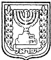
תכנון זמין מונה הדפסה 13