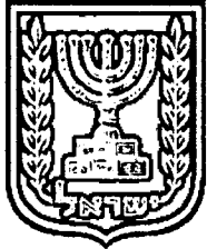
תכנון זמין מונה הדפסה 34

האם כוללת הוראות לענין תכנון תלת מימדי לא