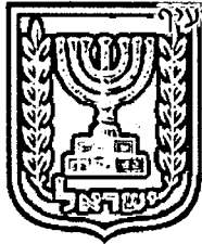
תכנון זמין מונה הדפסה 34