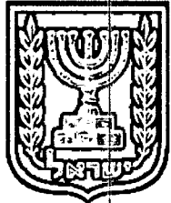
תכנון זמין מונה הדפסה 34

התכנית מסדירה אפשרות להקמת שער כניסה למרכז הבינתחומי הרצליה. מבנה השער יהיה אלמנט אדריכלי משמעותי המכיל בתוכו חדרי שומרים ומעברים הפרוסים לאורך כיכר ורחבת כניסה. השער יאפשר ניהול מעבר הולכי רגל באופן יומיומי ובאירועים רבי משתתפים בצורה בטוחה. בנוסף לבידוק ושליטה למעבר הולכי הרגל, ישמש השער מעבר כלי רכב מורשים באופן מבוקר.