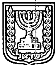
תכנון זמין מונה הדפסה 34

דף ההסבר מהווה רקע לתכנית ואינו חלק ממסמכיה הסטטוטוריים.