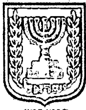
תכנון זמין מונה הדפסה 7