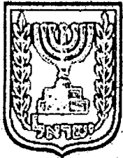
תכנון זמין מונה הדפסה 7

ג/23479 שינוי יעוד למגורים רחוב האירים מעלות