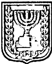
תכנון זמין מונה הדפסה 11