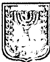
תכנון זמין מונה הדפסה 11