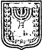
תכנון זמין מונה הדפסה 11